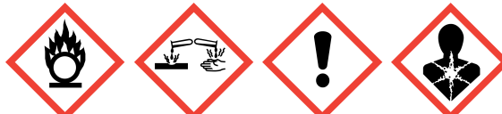
GHS03 GHS05 GHS07 GHS08