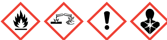
GHS02 GHS05 GHS07 GHS08