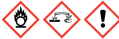
GHS03 GHS05 GHS07