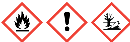
GHS02 GHS07 GHS09