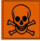
T - 독성