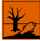
N - 환경에 위험